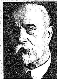
Tomáš Garrigue Masaryk

Legie – zahraniční vojsko složené z českých a slovenských emigrantů, válečných zajatců a zběhů rakouské armády.