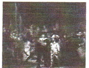
R. van Rijn: Noční hlídka

Typickým rokokovým malířem je Francouz Antoine Watteau (1684–1721), proslulý zobrazováním bezstarostné šlechtické společnosti uprostřed přírody.