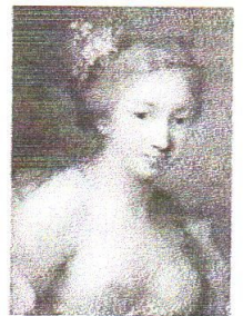
R. Carriera: Flóra

Závěrečné období baroka se někdy nazývá rokoko (asi 1730–1780). Je pro ně typická orientace na dvorské prostředí. Název rokoka se odvozuje od slova „ rocaille “, které označuje dobový ornamentální mušličkový motiv. Rokoko chápe umění jako příjemnou a půvabnou hru, která má sloužit společenské zábavě. Libuje si v hravosti, v miniatuře a dekorativnosti.