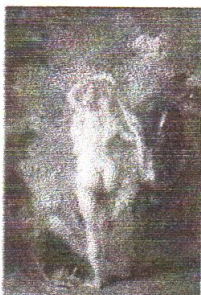
A. Watteau: Parisova volba

Základy barokního malířství položil Ital Caravaggio (1573–1610). Pro výtvarné umění baroka je charakteristické zobrazení niterných až extatických stavů, využití realistických motivů, kontrast světla a stínu. Caravaggio svým dílem ovlivnil nejen vlámského malíře Petera Paula Rubense (1577–1640) a holandského velikána výtvarného umění Rembrandta van Rijna (1606–1669), v jejichž obrazech vrcholí barokní malířství, ale také např. španělského malíře Diega Velázqueze (1599–1660), mistra portrétů.