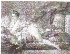
F. Boucher: Odaliska

Pro uměleckou tvorbu je typická citová vroucnost a smyslová naturalistická konkrétnost, vedle toho je však také zdůrazněna lidská bezmocnost vůči pomíjivosti života. Důraz je kladen na duchovnost, příznačné jsou také mysticismus a hyperbolizace záporných jevů (hyperbolizace – nadsazování; hyperbola – nadsázka). Barokní díla jsou charakteristická silným dramatickým napětím, vycházejícím z protikladu ducha a hmoty. Člověk je postaven mezi absolutní síly zla a dobra, satana a boha, zatracení a vykoupení.