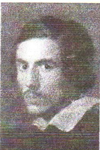
G. L. Bernini autoportrét

Pro barokní architekturu je typický cit pro kompozici a monumentalita. Byly budovány hlavně okázalé církevní stavby, ale také zámky doplněné zahradami a parky. Vzhled budov se podstatně změnil. Místo přímky a pravého úhlu nastoupila křivka a oblouk. Výraz se podřizoval dramatickému vyznění – zobrazované se vlní a působí dojmem pohybu. Mohutné kopule a okna často přivádějí světlo s takřka divadelním účinkem. Celkový dojem násobí fresky, které zvětšují prostor, štuky, zlacení a různé druhy umělých mramorů.