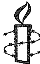
logo Amnesty International

Slovo ombudsman je švédské (původ má v islandštině, umbuk = moc) a označuje osobu jednající v zájmu jiné osoby. Prvním veřejným ochráncem práv v ČR je JUDr. Otakar Motejl. Sídlem je Brno. Internetové stránky veřejného ochránce mají adresu www.ochrance.cz . Slib, který ochránce skládá, zní: Slíbují na svou čest a svědomí, že svou funkci budu vykonávat nezávisle a nestranně, v souladu s Ústavou a ostatními zákony a že budu chránit neporušitelnost práv.